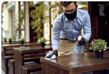
(ČSOB, redakčně kráceno)

Výsledky průzkumů podnikatelských a spotřebitelských nálad v zemích EU ukazují, že s nástupem podzimní vlny nákazy opadají již tak opatrný optimismus podnikatelů i spotřebitelů a situace začíná stále více připomínat jarní měsíce. Když se podíváme na situaci v ČR, tak zde je sice vidět určité drobné zvýšení důvěry v průmyslu a v obchodě, avšak současně nelze přehlédnout její výrazný propad ve službách. Zatím to vypadá tak, že podzimní vlnu koronaviru odnesou služby. Průmysl zatím funguje bez výraznějších změn, pozitivní jsou očekávání v obchodě i ve stavebnictví. Přesto to neznamená, že kromě služeb mají všichni vyhráno. Stále je třeba počítat s rizikem poklesu zahraniční poptávky, který by se odrazil i na českém exportu, a tedy i v průmyslu, nebo s možným rozšířením karantén, jež by zbrzdilo fungování dotčených firem.