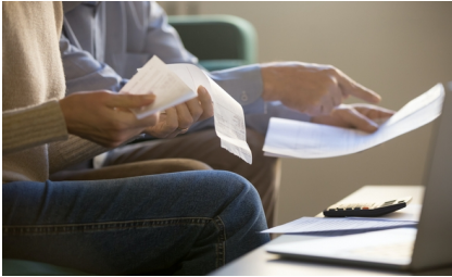
(Modrá pyramida, redakčně kráceno)

Modrá pyramida je připravena individuálně pomoci svým klientům, kteří budou v důsledku aktuální situace potřebovat úlevy v dalším splácení závazků. Klienti budou mít možnost požádat za pomoci on-line formuláře na webových stránkách o úlevy formou odložení splátek jistiny nebo celých splátek na období 3 měsíců. Ke konci září Modrá pyramida umožnila svým klientům odložit splácení u 6364 úvěrů, přibližně 14 % klientů se již vrátilo ke splácení.