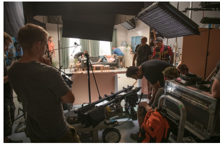
(Uniqa, redakčně kráceno)

Uniqa připravila svoji podzimní reklamní kampaň, věnovanou znovu pojištění domácnosti. Marketing Uniqa sází na mediální mix televize a on-line, který se osvědčil už v předchozích vlnách. K tomu tentokrát přidá i rádio. Všechna sdělení v různých médiích se budou odvíjet od TV spotu, jenž upozorňuje na nadstandardní asistenční služby v domácnosti. Nový asistenční servis k pojištění domácnosti nabídne klientům například sehnání řemeslníka a opraváře, nebo právní poradenství poskytne operativní pomoc proti kybernetickým rizikům, jako je zneužití osobních dat, škodlivý software, vydírání, pomluva, kyberšikana apod., a umí zasáhnout i při zneužití platební karty a problémových on-line nákupech.