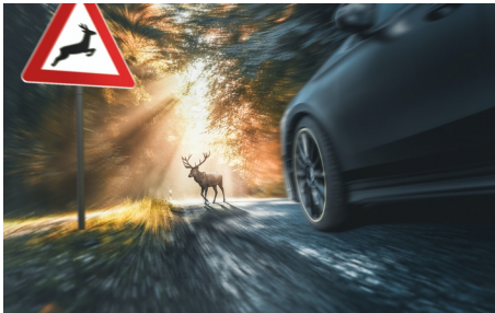
(Allianz, redakčně kráceno)