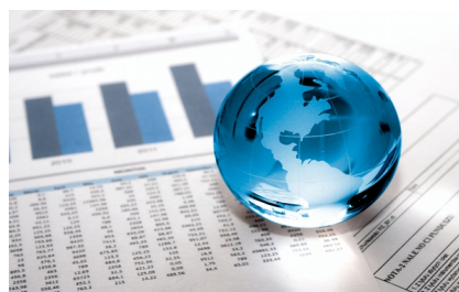
(Raiffeisenbank, redakčně kráceno)

bilanci zahraničního obchodu měl deficit s ropou a zemním plynem, který se snížil o 3,8 miliardy korun. Snížil se i schodek bilance základních kovů.