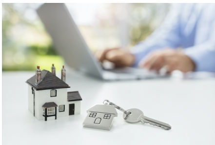
(Modrá pyramida, redakčně kráceno)

Klienti Modré pyramidy si mohou založit stavební spoření on-line pohodlně přímo z mobilu v MP Home. Vše vyřídí odkudkoliv a během několika minut. Novinka odstartovala 30. září 2020. V MP Home mohou klienti nejen zakládat nové stavební spoření, ale jdou v ní také spravovat stávající služby od Modré. Pro aktivaci MP Home stačí jedna návštěva pobočky a dále už vše funguje on-line.