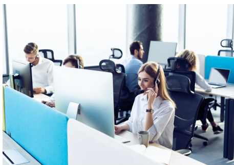
(Česká spořitelna, Raiffeisenbank, redakčně kráceno)