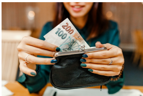
(Equa bank, redakčně kráceno)

Koronavirová pandemie se prozatím neprojevila v peněženkách 60 % Čechů. Pokud Češi o své příjmy během pandemie přišli, bylo to především z důvodu dočasného snížení mzdy ze strany zaměstnavatele. Nejčastěji takto přišli až o 20 % svých příjmů. Přesto jsme národ optimistický. Strach z toho, že pandemie negativně ovlivní jejich finance do budoucna, má jen 13 % Čechů. Nicméně neponecháváme nic náhodě a raději si začínáme vytvářet finanční polštář. Pod vlivem koronavirové epidemie začala spořit více než třetina Čechů. 60 % také omezilo své výdaje, nejčastěji za letošní dovolenou. Vyplývá to z červencového výzkumu Equa bank na reprezentativním vzorku české populace.