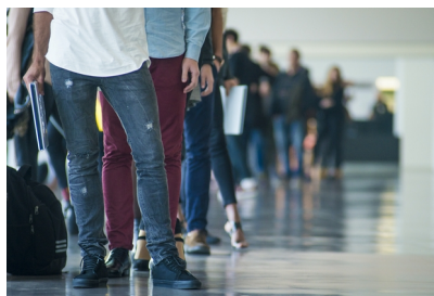
(Raiffeisenbank, redakčně kráceno)

zaznamenána již tradičně v okresech Karviná (6,9 %) či Bruntál (6,0 %). Počet volných pracovních míst zůstal vysoký, když v lednu dosáhl téměř 341 tisíc.