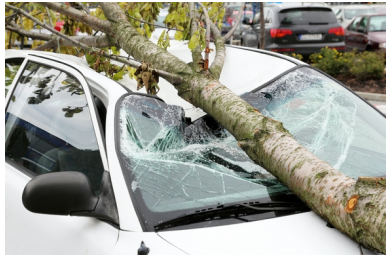
(Slavia pojišťovna, redakčně kráceno)