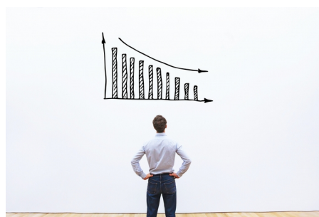
(Ministerstvo financí, redakčně kráceno)

na výdajové straně snižuje o 2,9 mld. Kč rozpočet Ministerstva obrany. O 1,5 mld. Kč se krátí výdaje související se slevami na jízdné, které nebudou vzhledem k omezenému cestování využity. Na příjmové straně státního rozpočtu dochází ke snížení daňových příjmů v úhrnu ve výši 55,7 mld. Kč, což je způsobeno očekávaným poklesem ekonomické aktivity.