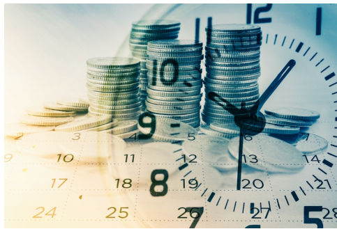
(Stavební spořitelna České spořitelny, Raiffeisen stavební spořitelna, redakčně kráceno)

zdarma, která odstartovala v lednu tohoto roku, spořitelna prodlužuje až do 31. 5. 2020. Ke stejnému datu prodlužuje také sjednání úvěru REKO půjčka bez poplatku za uzavření úvěrové smlouvy. Jedná se o úvěr na rekonstrukce a modernizace až do 1 milionu Kč bez zajištění. Klienti s úvěrovým produktem od Buřinky (Stavební spořitelny České spořitelny), tzn. s hypoúvěrem nebo úvěrem od Buřinky, úvěrem ze stavebního spoření nebo překlenovacím úvěrem, mohou požádat o tříměsíční odklad splátek. Požádat o něj je možné od 20. března do konce dubna na stránkách www.burinka.cz . Splátky začne Buřinka odkládat již od 1. dubna. Klienti nebudou muset v průběhu tří měsíců odkladu platit žádné splátky ani poplatky a Buřinka za ně navíc uhradí pojištění schopnosti splácet, mají-li ho sjednané.