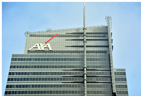
(Uniqa, AXA redakčně kráceno)

Klienti mohou posílat potřebné dokumenty on-line. Stačí je naskenovat nebo třeba vyfotit mobilním telefonem a jednoduše nahrát do aplikace E-Podatelná. Dokumenty jsou v AXA během pár sekund a ihned může začít jejich zpracování.