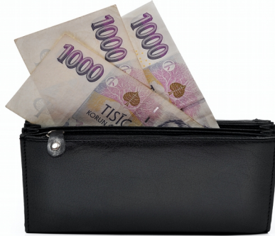
(Equa bank, redakčně kráceno)

finanční situaci konsolidovat (sloučit) půjčky do jednoho úvěru a snížit si tak výši měsíčních splátek.