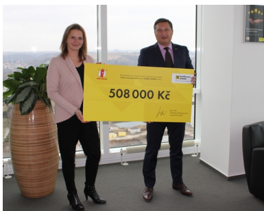
(Raiffeisenbank, redakčně kráceno)

Raiffeisenbank podporuje nadaci Dobrý Anděl už více než osm let. Jen v loňském roce pro ni získala částku přesahující 1,2 milionu korun. Naposledy předala banka nadaci částku 508 tisíc korun z charitativního projektu „Dobrá rána pomáhá“. Sami zaměstnanci podpořili vloni konkrétní projekty nadace svými pravidelnými příspěvky z výplaty částkou přes 740 tisíc korun. Pomoc přitom probíhá na několika úrovních. Dobrymi anděli byly v loňském roce zhruba tři stovky zaměstnanců banky, kteří ze své výplaty pravidelně přispívali na prospěšné aktivity nadace. Raiffeisenbank sdílí transparentní hodnoty Dobrého anděla, tedy pravidelné, včasné a adresné rozdělování příspěvků potřebným do posledního haléře.